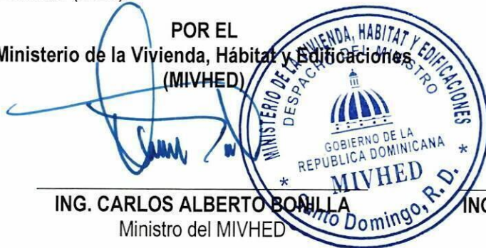
ING. CARLOS ALBERTO BONILLA Ministro del MIVHED

POR EL Ministerio de la Vivienda, Hábitat y Edificaciones (MIVHED)