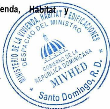
ING. CARLOS ALBERTO BONILLA Ministro del MIVHED

Por el Ministerio de la Vivienda, Habitat y Edificaciones (MIVHED)